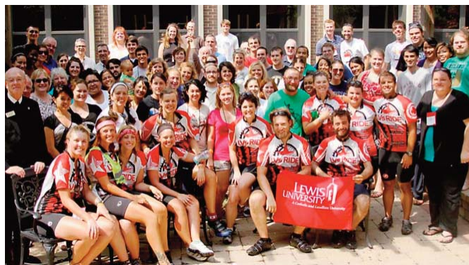
Photo de groupe

là-haut et que (pas de chance) je n'avais plus qu'à faire demi-tour et regagner le tout...