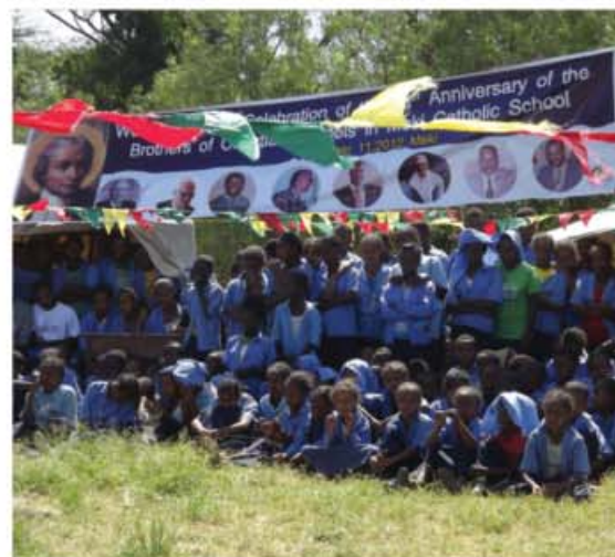
La nouvelle bibliothèque de l'école catholique de Meki augmente la chance des élèves d'étudier aussi le soir dans des installations adéquates et un environnement positif.