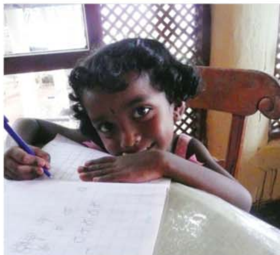
LCES à Colombo permet l'accès à l'éducation aux enfants pauvres du bidonville.