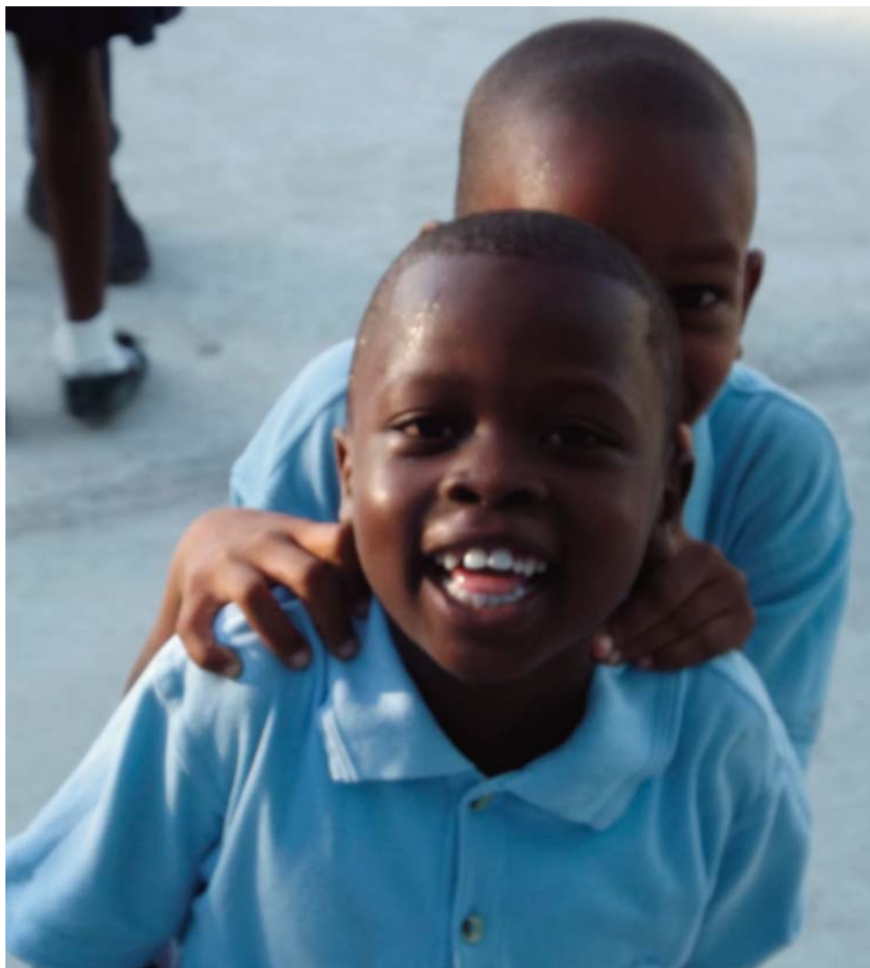
La nouvelle école de Port-au-Prince a été construite avec le soutien des lasalliens de tout le monde.