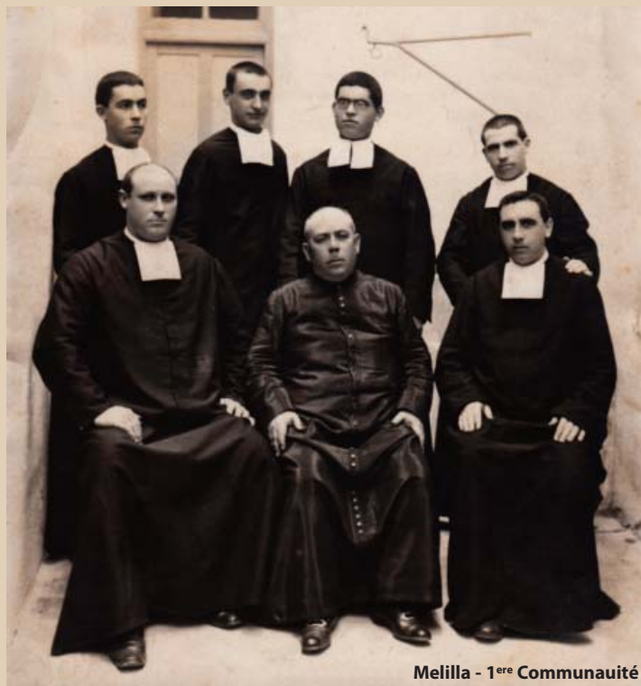
Melilla - 1 ère Communauté

Melilla, ville espagnole sur la côte sud de la Méditerranée, siège d'une Capitainerie Générale et de nombreux régiments, vit arriver les Frères en septembre 1912. Ainsi de nombreux Frères pourraient choisir, pour accomplir leur service militaire rendu obligatoire pour eux depuis 1910 : à côté de légères obligations de service, ils mettraient à profit leurs temps libres pour assurer des heures d'enseignement au nouveau collège Nuestra Señora del Carmen. Après six années dans des locaux de fortune, les Frères et leurs élèves purent enfin se loger dans un établissement neuf. Depuis, il n'a pas cessé de se développer et peut célébrer avec fierté son centenaire.