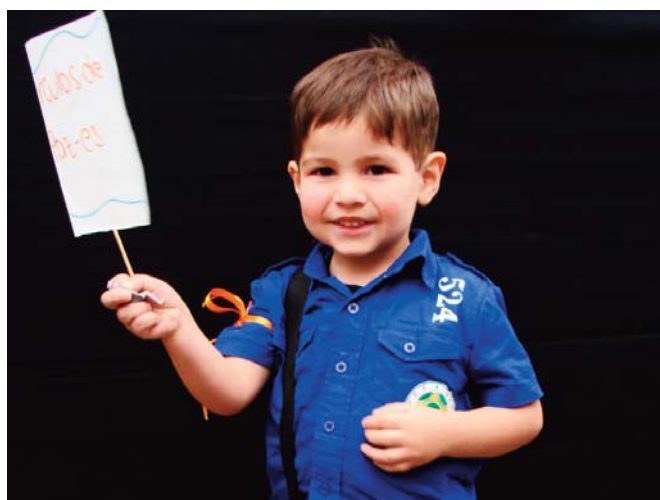
Niño Constructor de Paz por Jonnie Parra