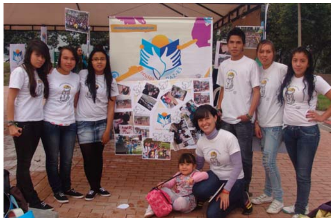
Animadores de paz-es encuentro por la convivencia en Usme

En este sentido, en la localidad de Usme en la ciudad de Bogotá y Magangué en el Departamento de Bolívar se desarrolla el proyecto Círculos de Paz-es . Este proyecto es una iniciativa juvenil, que in-