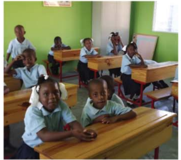
La nueva escuela de Puerto Príncipe es un signo de esperanza para el futuro de la juventud haitiana y del país.