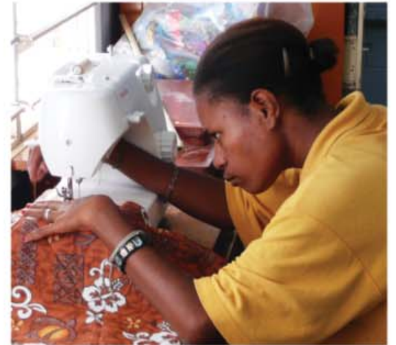
HYDC en Papúa Nueva Guinea facilita la oportunidad de colocar a los estudiantes para que puedan aprender una profesión.