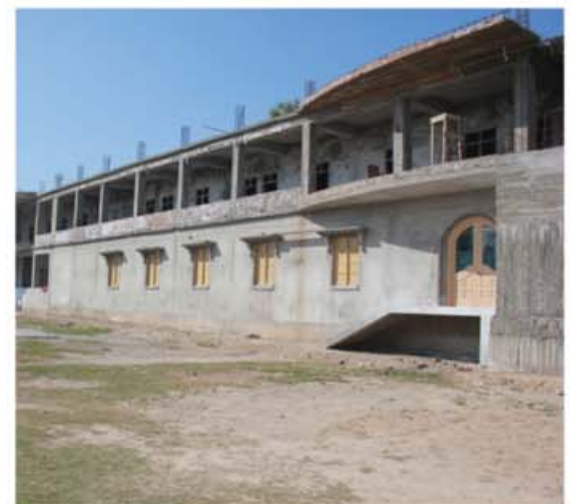
La construcción del Colegio La Salle de Faisalabad permite a las niñas -que en caso contrario tendrían que dejar de ir a la escuela debido a la legislación paquistaní- continuar recibiendo la educación secundaria de primer ciclo.