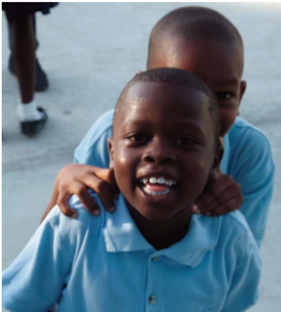
La nueva escuela de Puerto Príncipe ha sido construida con el apoyo de lasalianos de todo el mundo.