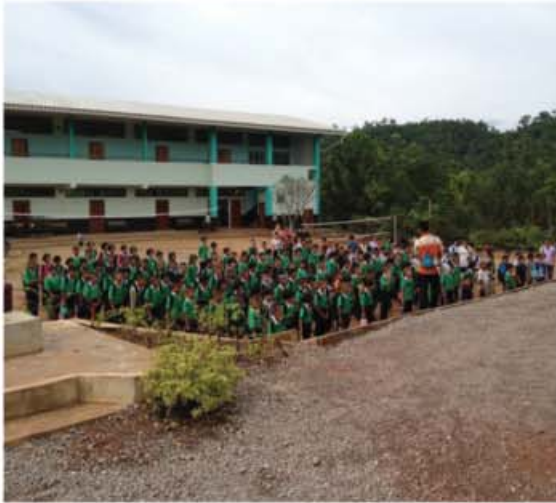
Gracias al nuevo edificio el Centro de Aprendizaje Parmenia, en Tailandia, puede proporcionar educación primaria a 239 niños apátridas.